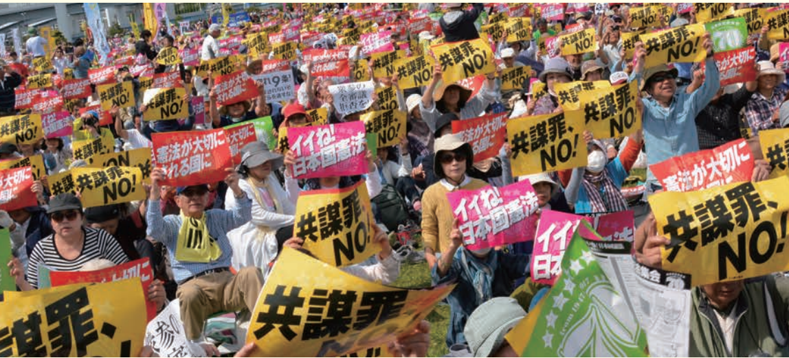
2017年「施行70年、いいえ！日本国憲法5・3集会」5万5000人参加（東京・有明防災公園）

“安倍9条改憲”反対の一点で手をつなぎましょう。3000万人の「戦争はイヤだ」の声を集めて、9条を未来につないでいきましょう。