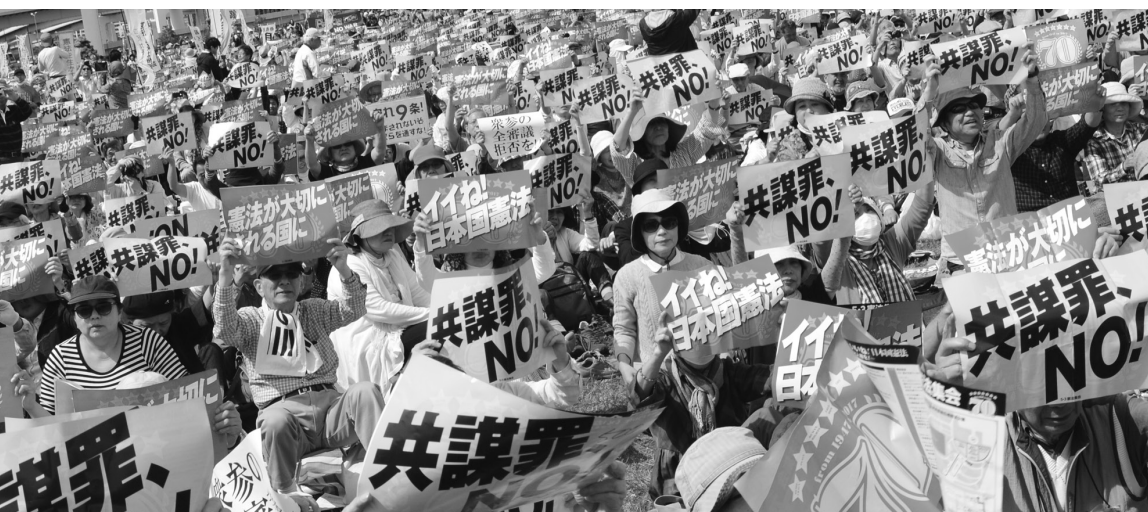
2017年「施行70年、いいネ！日本国憲法5・3集会」5万5000人参加（東京・有明防災公園）

“安倍9条改憲”反対の一点で手をつなぎましょう。3000万人の「戦争はイヤだ」の声を集めて、9条を未来につないでいきましょう。