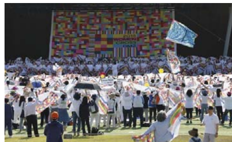
各国の女性は北から南へ走破。DMZを越えた

オーストラリア・メルボルン出身。2005年よりNGOピースボートの国際コーディネーターとして核廃絶、脱原発、平和教育や歴史認識など、様々なプロジェクトに携わる。2015年に「ウィメン・クロス・DMZ」の一員として朝鮮半島の北から南へ非武装地帯(DMZ)を通過し、その後も同実行委員や顧問として関わる。2020年9月、韓国政府統一部から「朝鮮半島平和親善大使」に委嘱。